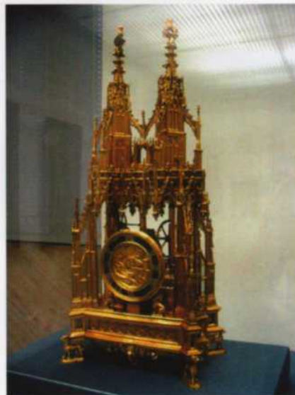
Museo Nacional Germánico (Nuremberg). Reloj de Felipe el Bueno de 1430.

muelles de marcha y sonería de horas; pero no solamente su antigüedad y su estado de conservación son admirables; con mucho, su belleza supera cualquier objeto artístico de su época. Para terminar, en la sección de arte popular se concentra una pequeña colección de relojes de la Selva Negra.