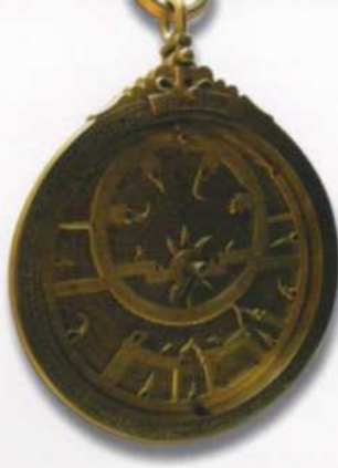
Museo de astronomía e historia de la técnica (Kassel). Astrolabio valenciano de Ibn Said de 1086.