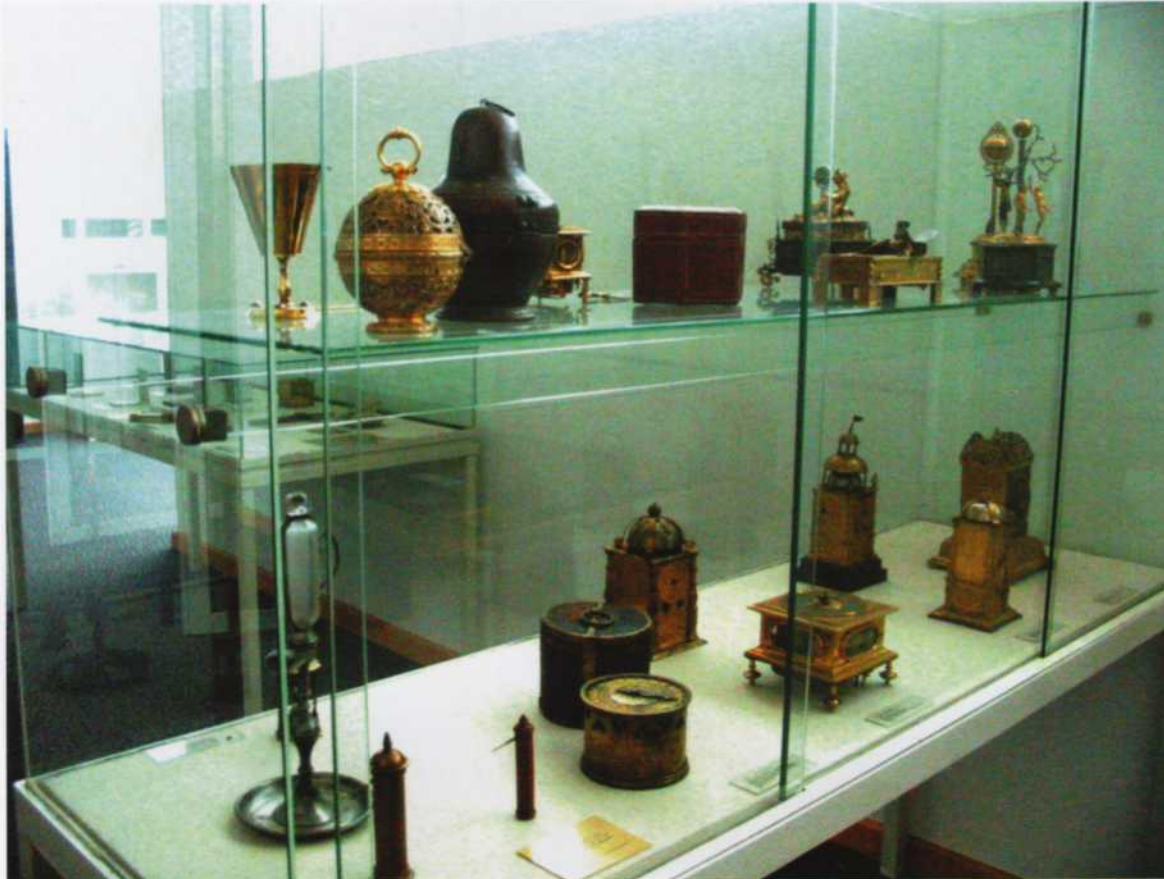
Museo Nacional Germánico (Nuremberg). Vitrina de relojes góticos.

muelles de marcha y sonería de horas; pero no solamente su antigüedad y su estado de conservación son admirables; con mucho, su belleza supera cualquier objeto artístico de su época. Para terminar, en la sección de arte popular se concentra una pequeña colección de relojes de la Selva Negra.