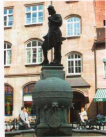
Nuremberg. Fuente dedicada al relojero Peter Henlein.

(Männleinlaufen) del reloj de la Iglesia de Nuestra Señora (Frauenkirche). La escena animada representa el juramento de los siete electores ante Carlos IV a raíz de la concesión de la Bula de Oro por el emperador en 1356. Además de la gran pinacoteca con obras de Durero, Holbein y Cranach, entre otros muchos, y una de las colecciones de instrumentos musicales más importantes del mundo, en el Museo Nacional Germánico hay una pequeña pero densa colección de relojes.