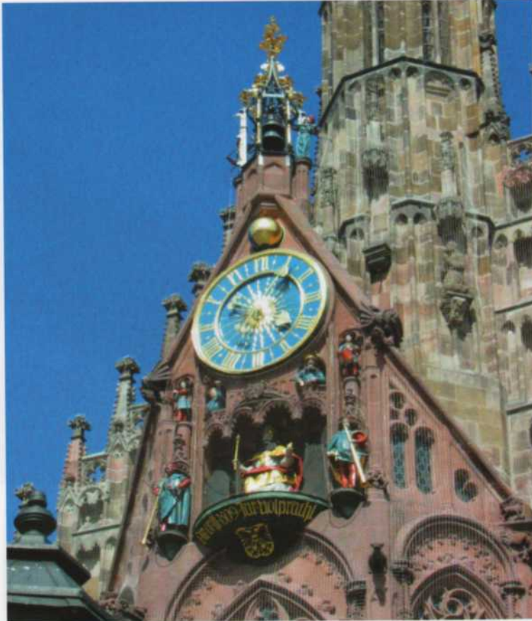
Nuremberg. Autómatas del reloj de la Iglesia de Nuestra Señora.