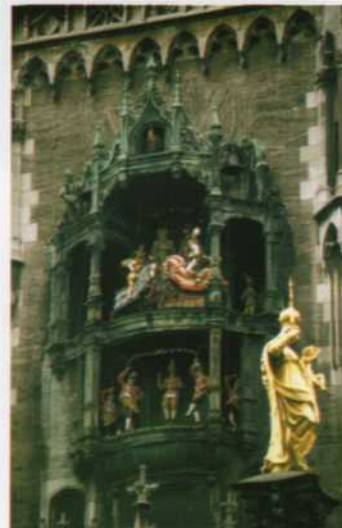
Munich. Autómatas del reloj del Ayuntamiento Nuevo.

perdersé por otros centros de interés o por la librería, salir a tomar unas cervezas por los alrededores de la Marienplatz y ver en acción los autómatas del carillón del Ayuntamiento Nuevo (Neues Rathaus) situado en la misma plaza. Otro día y con renovada energía, se debería hacer una visita al Museo Nacional Bávaro (Bayerisches Nationalmuseum) que conserva otra magnífica colección de relojería mecánica de los siglos XVI y XVII.