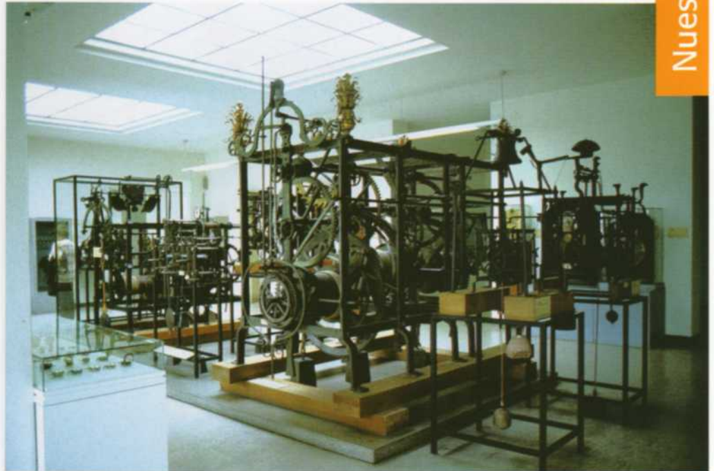
Museo Alemán (Munich). Sala de relojes de torre.

alta precisión (un Riefler de 1905) en el departamento correspondiente; debe poner un poco de su imaginación y buscar los relojes musicales en el departamento de instrumentos musicales, relojes astronómicos y astrolabios en la sección de astronomía y autómatas del siglo XVI en el departamento de computación y automatismos; para luego