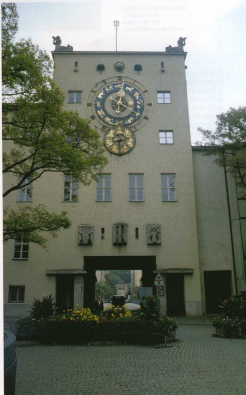
Museo Alemán (Munich). Reloj público.

Vilingen-Schwenningen se encuentra en los confines orientales de la Selva Negra y como es de esperar la parte principal del museo se destina a la exposición de relojes autóctonos que constituye un buen complemento a la colección ofrecida en Furtwangen. Sin embargo hay una interesante segunda parte indispensable por mérito propio que es el legado de relojes que Hellmut Kienzle coleccionaba desde su posición de empresario de la fabricación de relojes; la empresa Kienzle había abierto al público su museo privado en 1961, legando más tarde su colección a la ciudad. El grueso de la colección Kienzle lo constituyen los relojes de estilo renacentista de los siglos XVI-XVII de mesa, exagonales, en forma de crucifijo, de torre y con autómatas e indicaciones astronómicas procedentes de Estrasburgo, el sur de Alemania, Francia e Inglaterra. Una buena parte de la colección la ocupan los relojes de bolsillo de dicha época y posteriores con presencia de relojes esmaltados, con sonería de repetición y autómatas. En esta ciudad también se encuentra el Museo de la Industria Relojera (Uhrenindustriemuseum) dedicado a la tecnología de fabricación relojera básicamente del siglo XX.