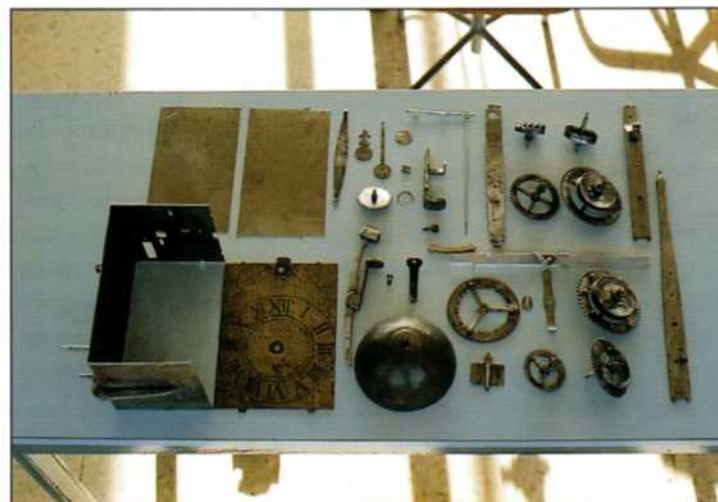
Despiece de reloj de Gironella