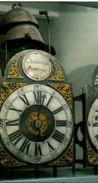
Reloj de Arenys

que había en muchas poblaciones, reproducirlos a escala reducida y ofrecerlos para uso doméstico a precio mucho más barato que las costosas piezas de importación. Es posible incluso que fabricar relojes fuera una salida honorable para algunos armeros que se quedaban sin trabajo al extinguirse la otrora famosa manufactura de las armas de fuego de Ripoll en beneficio de otras localidades como el País Vasco y Toledo.