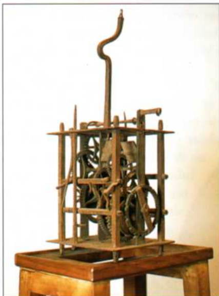
Máquina del reloj de Faliu Roca

La falta de tradición relojera en Cataluña y el desconocimiento en la materia que tenían los cerrajeros y armeros, no fue impedimento para copiar los ancestrales relojes de campanario