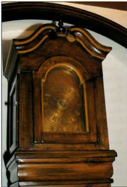
Reloj Moyà número 105 con caja original